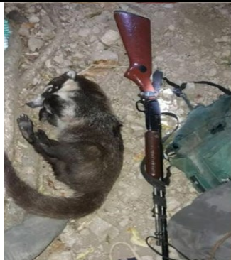
Pezote muerto por un disparo de fusil | Foto Ministerio de Medio Ambiente, abril 2019.